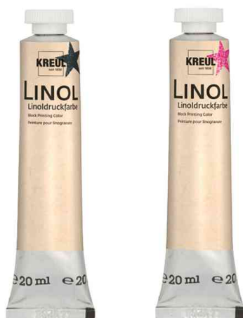
Linoldruckfarbe, 20 ml Tube