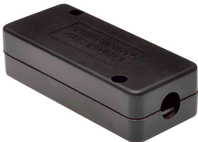
Verbindungsmodul Kat. 7

- zum verbinden von zwei geschirmten oder ungeschirmten Installationskabeln der Kategorie Kat. 7, Abwärtskompatibel zu C6 A und C5e