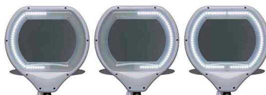
LEDs in 3 Bereichen dimmbar