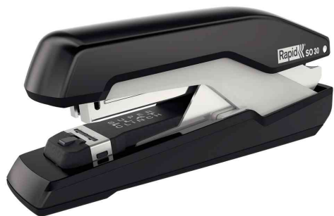
Flachheftgerät Omnipress S030, schwarz / grau

- als Tisch- und Hand-Heftgerät geeignet