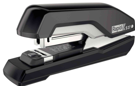
Flachheftgerät Supreme S27, schwarz / grau

- als Tisch- und Hand-Heftgerät geeignet