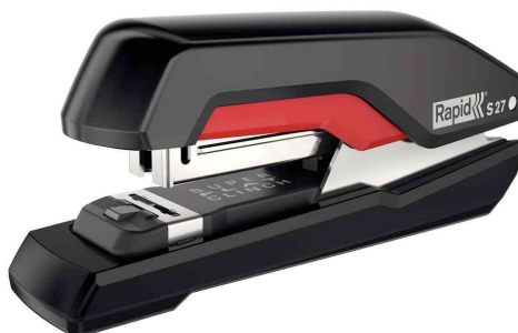
Flachheftgerät Supreme S27, schwarz / rot