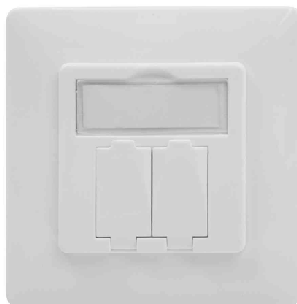
Leerdose für Keystone Module, designkompatibel