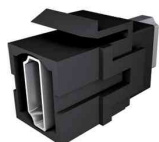
Zubehör: Keystone Jack HDMI