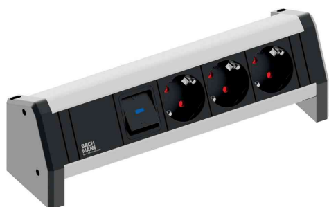
Steckdosenleiste DESK, 3-fach mit Schalter