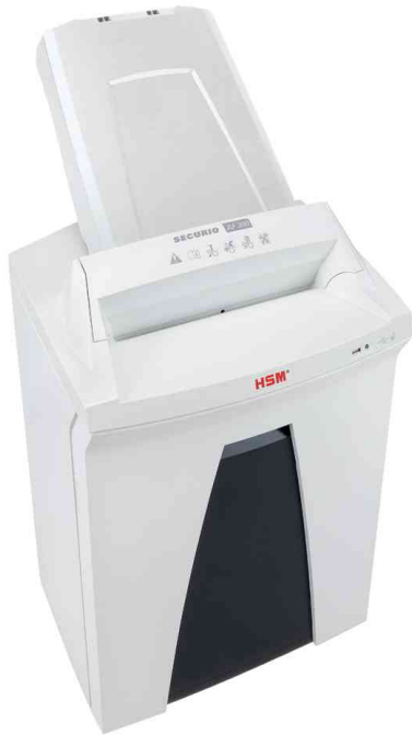
Auto-Feed Aktenvernichter HSM SECURIO AF300