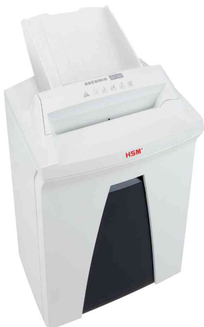
Auto-Feed Aktenvernichter HSM SECURIO AF150