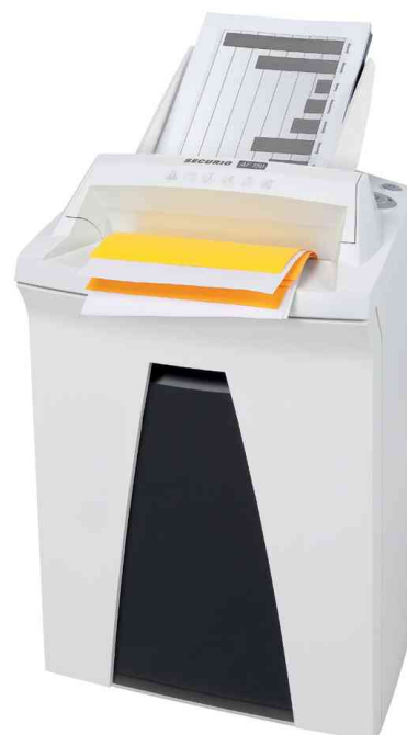
Blatteinzug für bis zu 150 Blatt