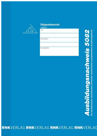
Ausbildungsnachweis-Block 5082, täglich