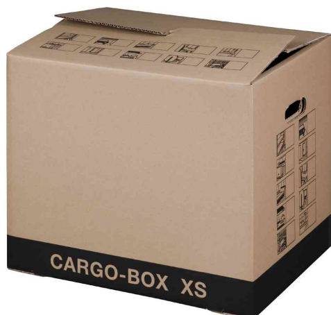
1) Umzugskarton "CARGO-BOX XS"