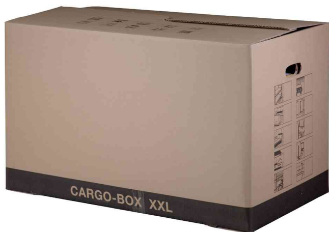
3) Umzugskarton "CARGO-BOX XXL"