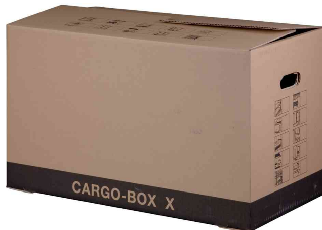
2) Umzugskarton "CARGO-BOX X"