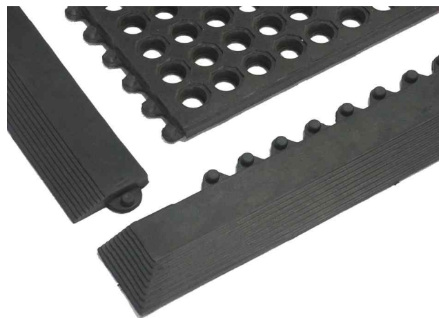
Detailansicht - Abschlussleisten