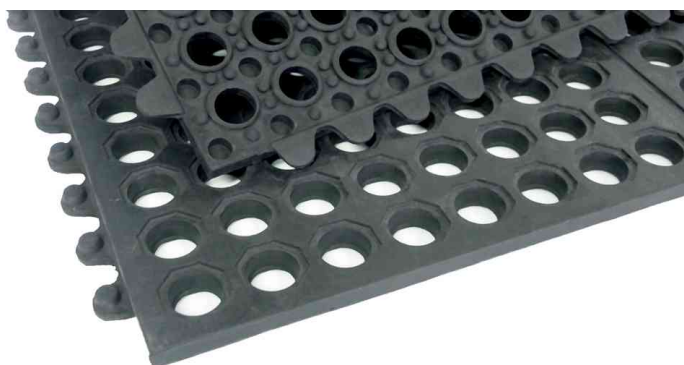
Arbeitsplatzmatte Yoga Octa Basic