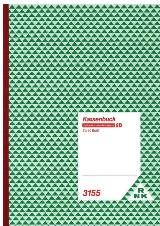
Kassenbuch DIN A4, mit Umsatzsteuererfassung