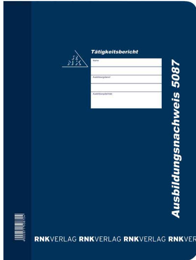
Ausbildungsnachweis-Hefter 5087, täglich

- Auszubildende in kaufmännischen, handwerklichen und gewerblichen Ausbildungsberufen