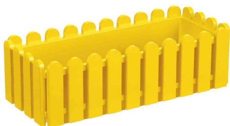
Blumenkasten Landhaus, gelb