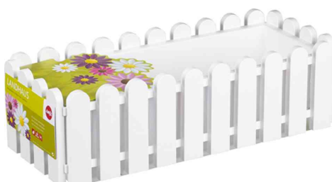
Blumenkasten Landhaus, weiß