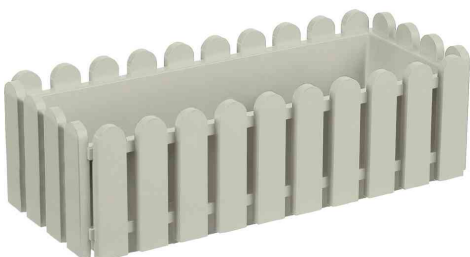
Blumenkasten Landhaus, seidengrau