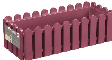
Blumenkasten Landhaus, rotviolett