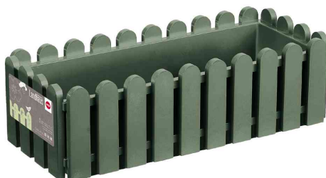
Blumenkasten Landhaus, lorbeergrün