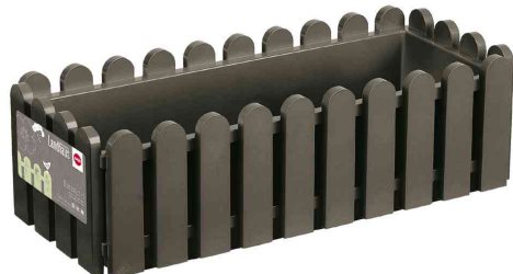
Blumenkasten Landhaus, rauchbraun