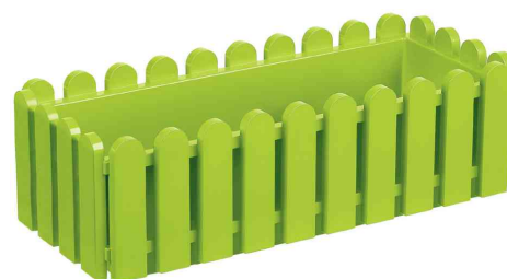
Blumenkasten Landhaus, grün