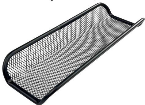
Stifteschale "the tray network", schwarz

- für das Unterbringen von Scheren, Brieföffnern und Stiften