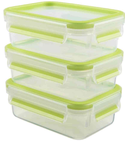
Frischhaltedose CLIP & CLOSE, hellgrün