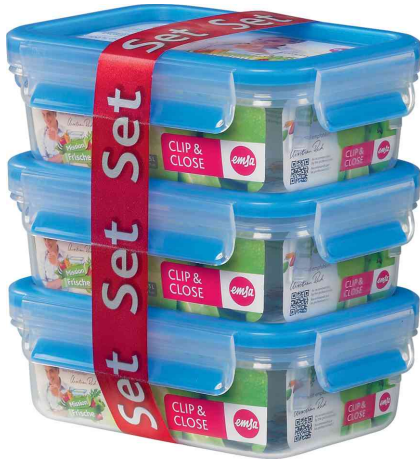
Frischhaltedose CLIP & CLOSE, blau