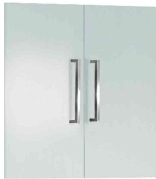
Zubehör: Vorbautüren-Set, 2 Ordnerhöhen, aus Glas