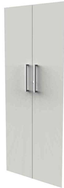
Zubehör: Vorbautüren-Set, 5 Ordnerhöhen, weiß