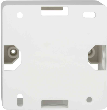
Aufputzgehäuse für Unterputzdosen , reinweiß