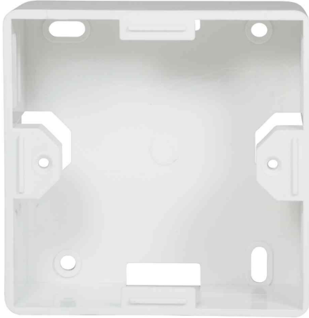
Aufputzgehäuse für Unterputzdosen, reinweiß