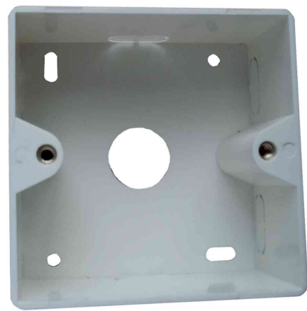
Aufputzgehäuse für Unterputzdosen, signalweiß