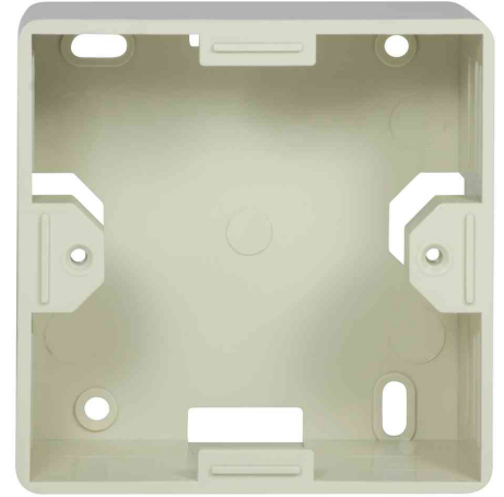
Aufputzgehäuse für Unterputzdosen, perlweiß