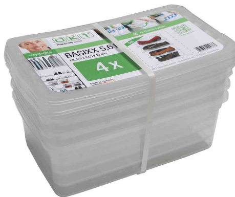
Aufbewahrungsboxen / Schuhboxen "bea", 4er Set