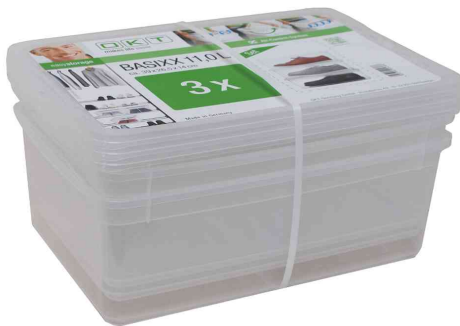
Aufbewahrungsboxen / Schuhboxen "bea", 3er Set