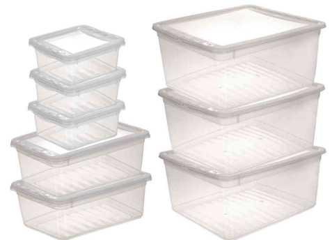
Aufbewahrungsboxen / Schuhboxen "bea", 8er Set