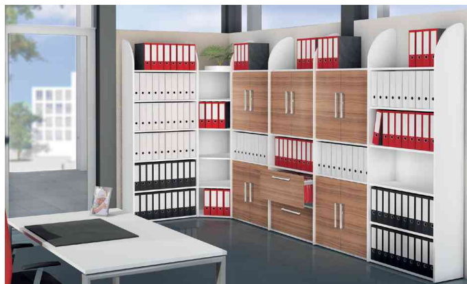
- Anwendungsbeispiel- mit Rückwand