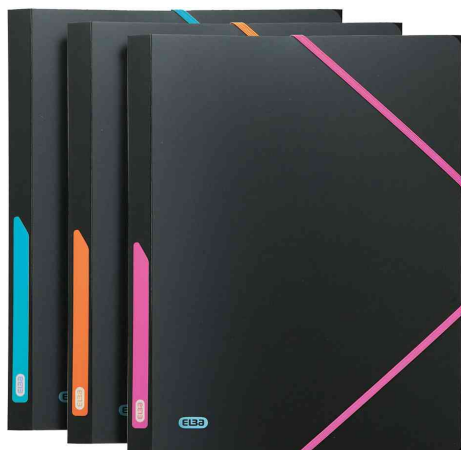
Eckspannermappe XL "ELBA for Students"

Weitere Produkte der ELBA for Students Serie finden Sie im WebShop!