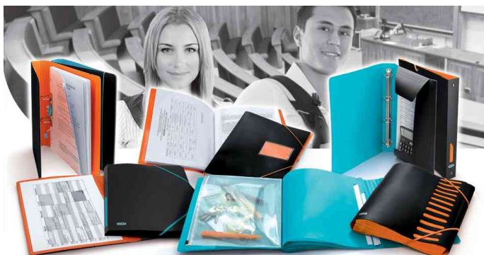
Serie ELBA for Students