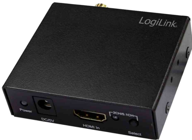
HDMI Audio / Video Konverter