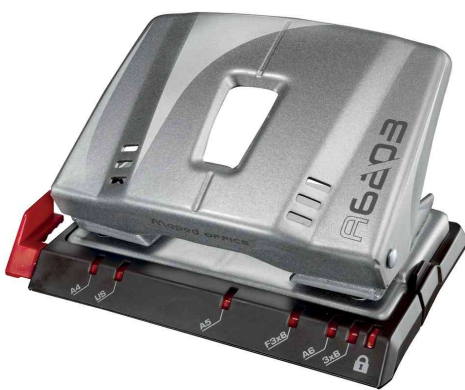
Locher Advanced A6203, silber