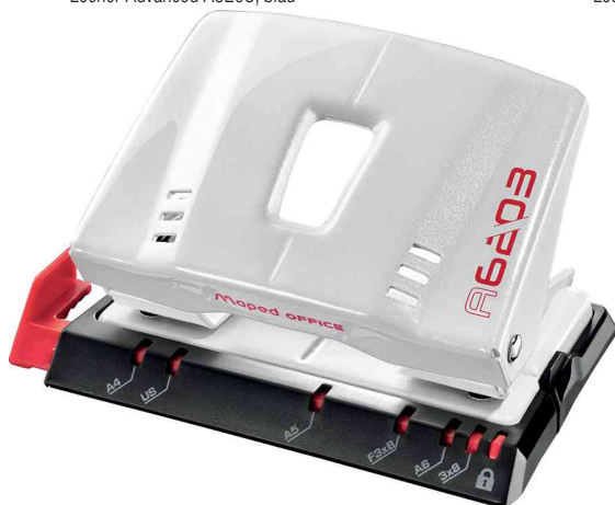
Locher Advanced A6203, weiß