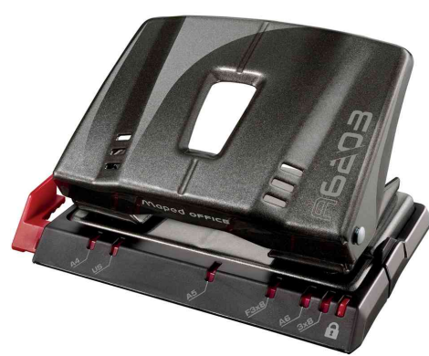
Locher Advanced A6203, taupe