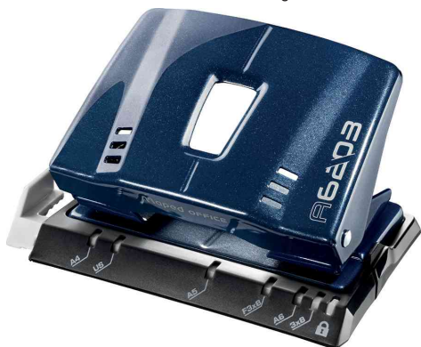
Locher Advanced A6203, blau