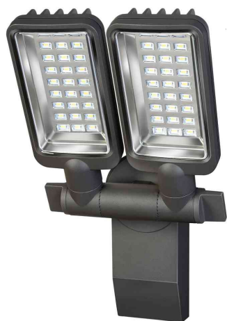
LED-Strahler Duo Premium City SV5405