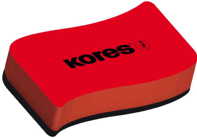
Tafellöcher / Whiteboard-Schwamm

- zur einfachen Trockenreinigung von Weißwandtafeln