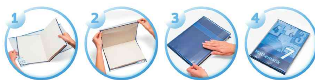
Buchscher HERMÄX, Anwendung