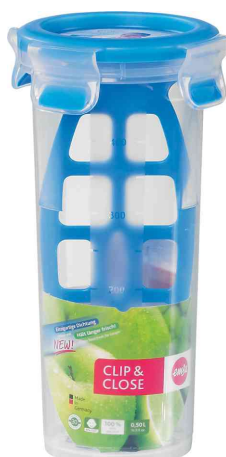
Mixbecher CLIP & CLOSE