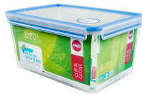
Frischhaltedose CLIP & CLOSE, 8,20 Liter N:\VivalP\Koepte\42250\508548_img_2.jpg