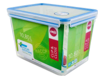
Frischhaltedose CLIP & CLOSE, 10,8 Liter N:\VivalP\Koepte\42250\508549_img_2.jpg