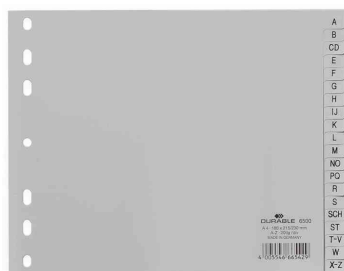
A-Z Kunststoff-Register, halbe Höhe, grau