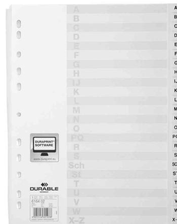
A-Z Kunststoff-Register, weiß, 24-teilig