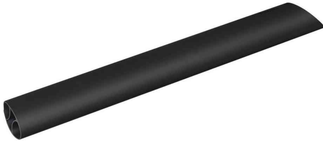
Tastatur-Handgelenkauflage I-Spire, schwarz

passend zu allen weiteren Produkten der Fellowes I-Spire Serie