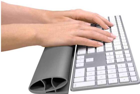
Tastatur-Handgelenkauflage I-Spire, Anwendung