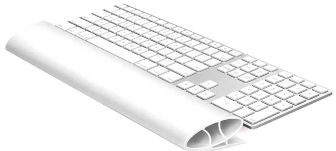
Tastatur-Handgelenkauflage I-Spire, Anwendung