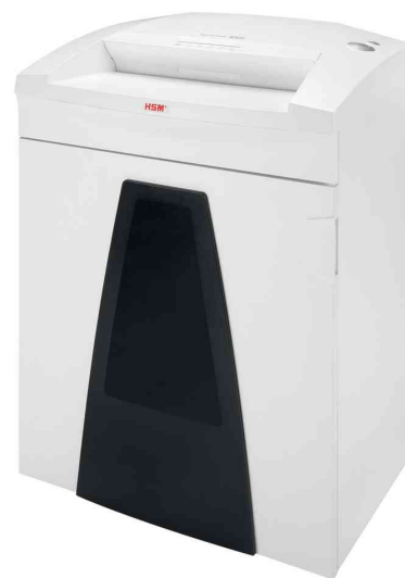
Aktenvernichter HSM SECURIO B35