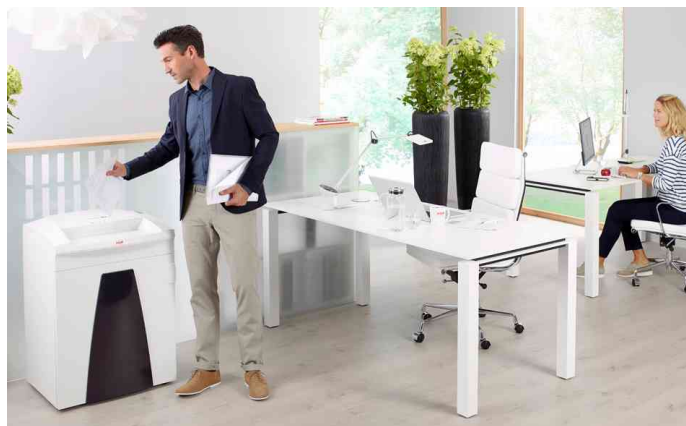
Aktenvernichter HSM SECURIO B34