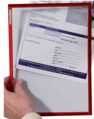
Magnet-Tasche FRAME IT X-tra!Line, rot