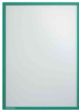
Magnet-Tasche FRAME IT X-tra!Line, grün