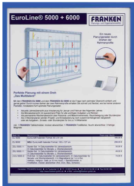
Magnet-Tasche FRAME IT X-tra!Line, blau