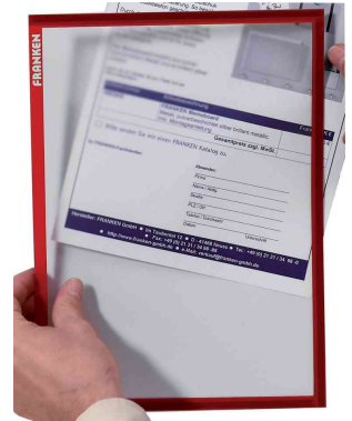
Magnet-Tasche FRAME IT X-tra!Line, rot