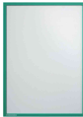
Magnet-Tasche FRAME IT X-tra!Line, grün