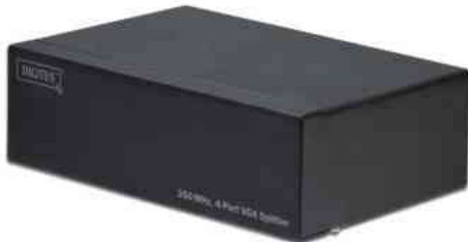
VGA Splitter 350 MHz, 4-fach