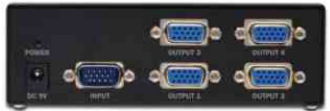
Detailansicht - Rückseite