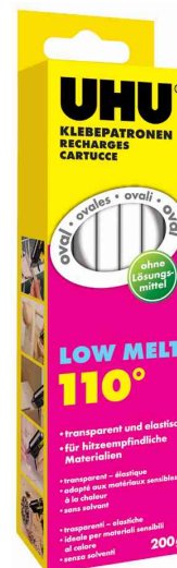
Klebepatrone Low Melt, 200 g