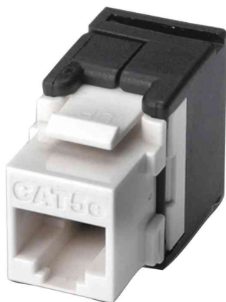
Keystone Jack Kat. 5e, Klasse D