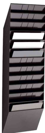
Wand-Prospekthalter "FLEXIBOXX 12", schwarz