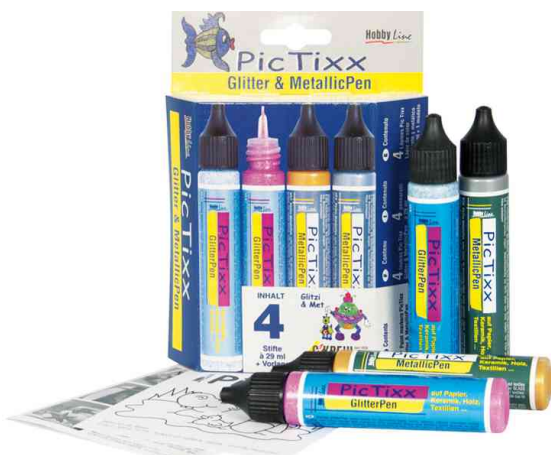
Glitter & MetallicPen Hobby Line "PicTixx", 4er-Set