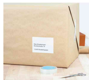
Universal-Etiketten PREMIUM, Anwendung