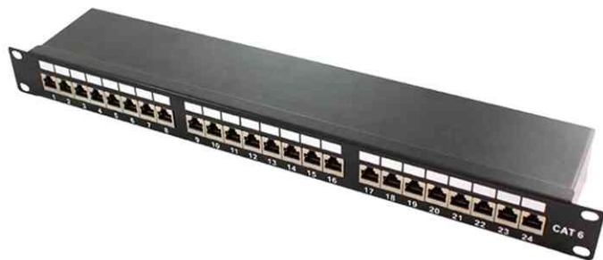
19" Patch Panel Kat. 6