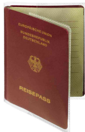
(1) Anwendungsbeispiel, 176 x 125 mm