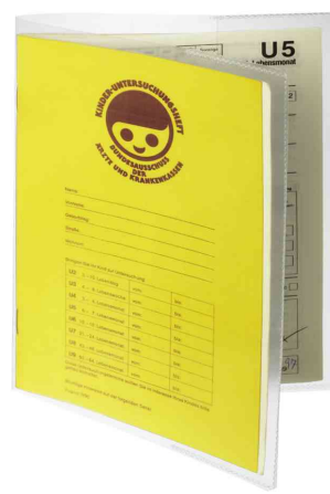
(3) Ausweishülle, DIN A5