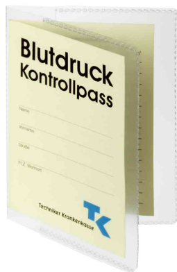
(2) Ausweishülle, DIN A7