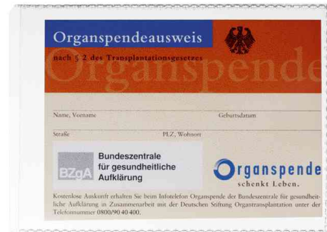
(4) Ausweishülle, DIN A7