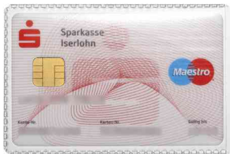
(1) Ausweishülle, 54 x 86 mm