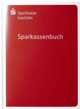
(5) Ausweishülle, DIN A6