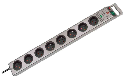
Prolongateur multiprise Super-Solid avec protection surtension, 8 prises