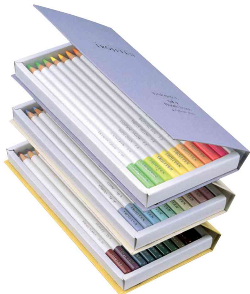
Buntstifte "IROJITEN" Edition 3 - offen