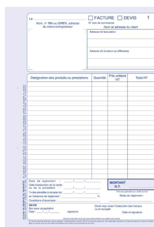
Manifold "Factures: auto-entrepreneurs", ouvert