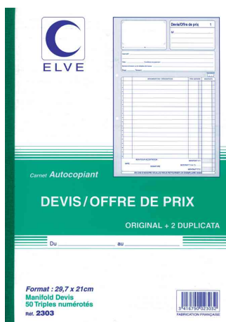
Manifold - Devis/Offre de prix, tripli