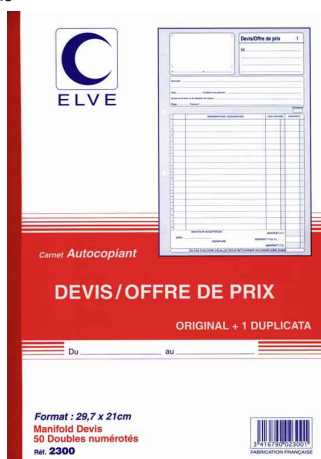
Manifold - Devis/Offre de prix, dupli