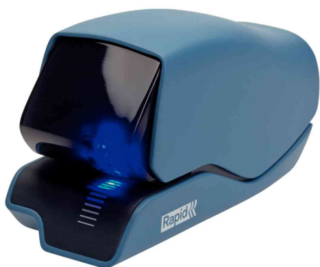
Elektro-Heftgerät Supreme 5025e, blau / grau