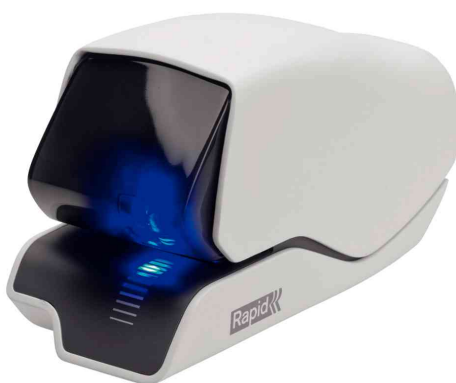
Elektro-Heftgerät Supreme 5025e, weiß / grau